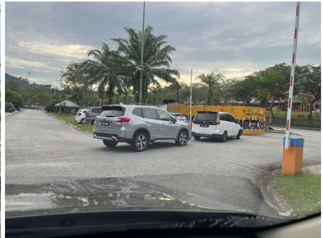
Gambar kesesakan kenderaan di Persiaran Pulau Lumut dan laluan keluar masuk dari Jalan Pulau Lumut U10/73