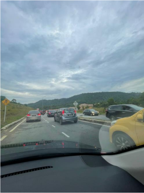
Kesesakan dari Setia Alam ke Persiaran Pulau Lumut